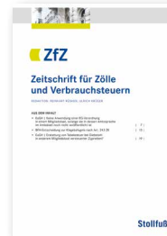
Zeitschrift für Zölle und Verbrauchsteuern