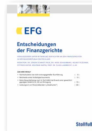
Entscheidungen der Finanzgerichte