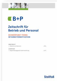
Zeitschrift für Betrieb und Personal