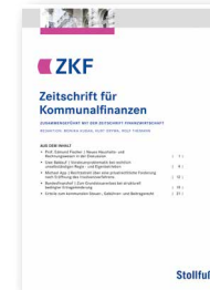
Zeitschrift für Kommunalfinanzen