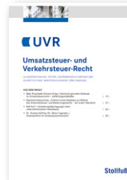
Umsatzsteuer- und Verkehrssteuer-Recht