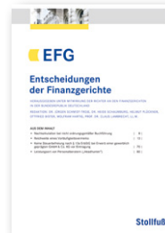
Entscheidungen der Finanzgerichte