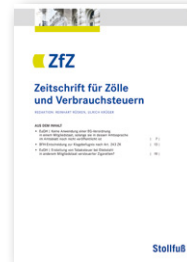
Zeitschrift für Zölle und Verbrauchsteuern