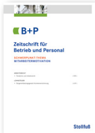
Zeitschrift für Betrieb und Personal