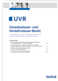
Umsatzsteuer- und Verkehrsteuer-Recht