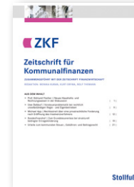
Zeitschrift für Kommunalfinanzen