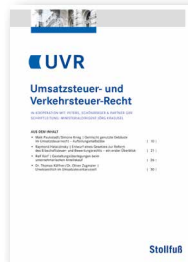
Umsatzsteuer- und Verkehrsteuer-Recht